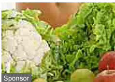
Sponsor I cibi sgonfia pancia (Starbene)