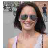
IL DRAMMA Choc a Napoli, niente sale operatorie Donna muore a 42 anni di Ettore Mautone