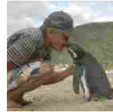
PIÙ CHE AMICI Il pinguino che nuota 8.000 km ogni anno per raggiungere l'uomo che lo ha salvato