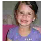
SCARAVENTATA A TERRA Rifiuta di togliere la giacca, maestra la uccide rompendole la testa di Federico Tagliacozzo