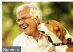
Sponsor Una corretta alimentazione influenza la vita media di un animale: vero o falso? (Purina)