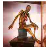
L'EVENTO Napoli. Porte aperte al Museo di Anatomia: è tra i più antichi e completi... di Marco Perillo