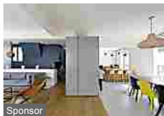
Sponsor La famiglia preferisce l'open space... anche in 5! (Living Corriere)